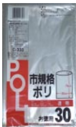
C - 3 3 3