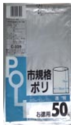
C - 3 3 5