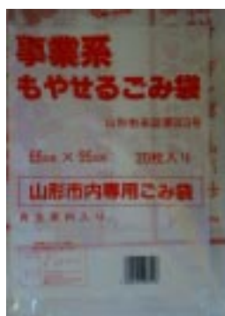
事業系もやせるごみ