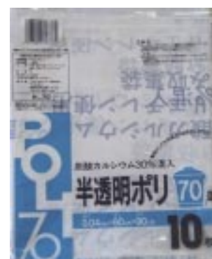
H - 7 0