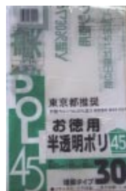
DT - 453