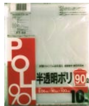
FT - 90