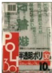
CT - 30