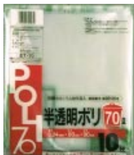
ET - 70