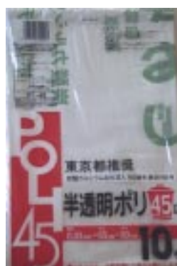
HT - 45