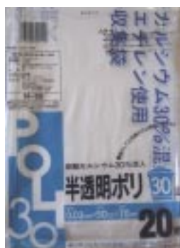
H - 3 0