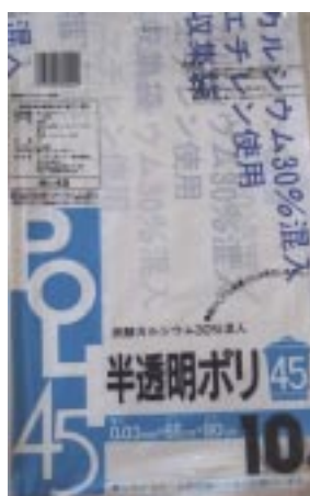
H - 4 5