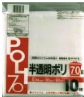
HT - 70