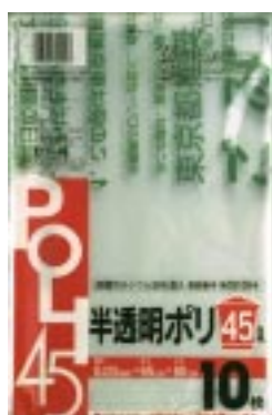
DT - 45