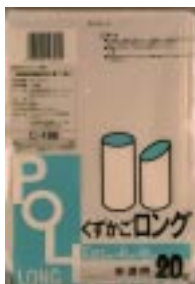
C - 1 6 6