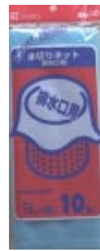
B N - 1 0