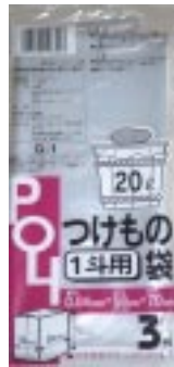
G - 1