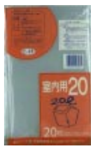
C - 2 3