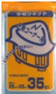
B N - 3 5