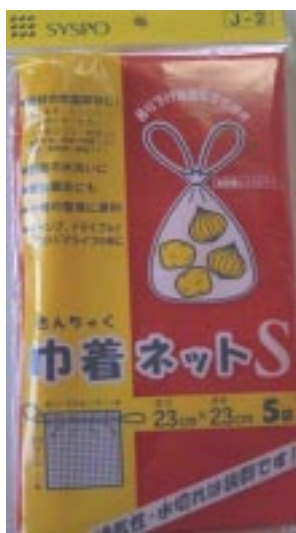
J - 2