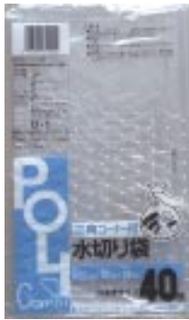
D - 1