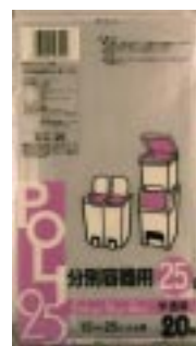
C C - 2 5