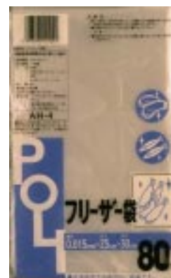
AH - 4