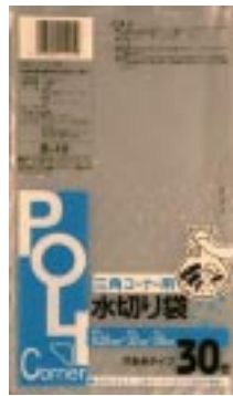
B - 1 0