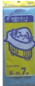
B N - 7