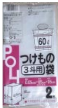
G - 3