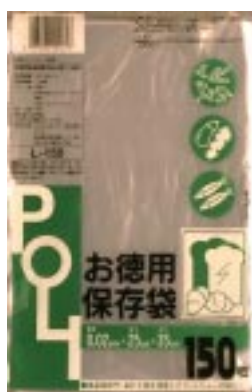
L - 150