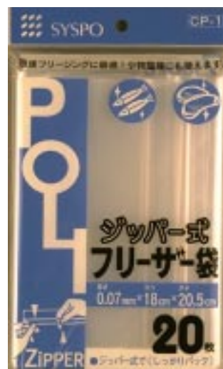
C P - 1