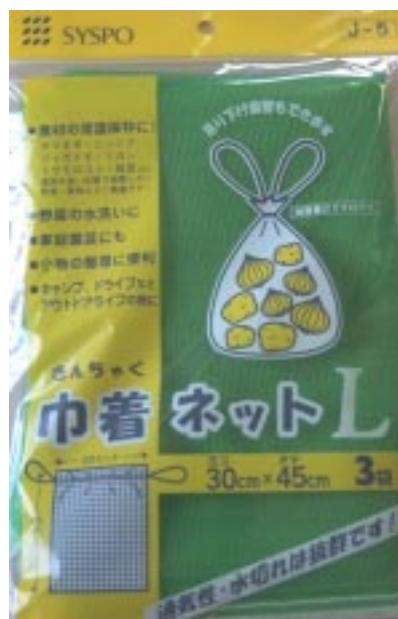
J - 5