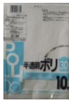
C - 3 4