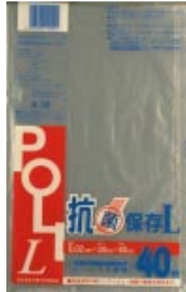
A - 3 0