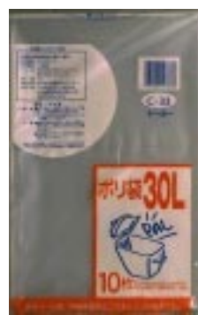
C - 3 3