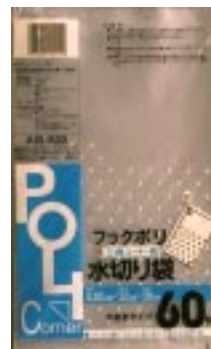
A B - 5 2 0