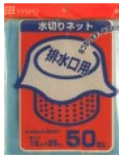
B N - 5 0