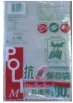
A - 1 0 0