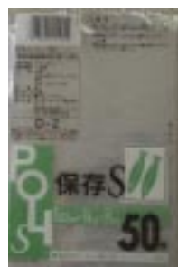
D - 2