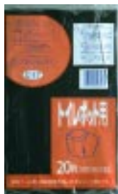
C - 1 7