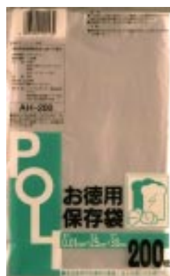
AH - 200