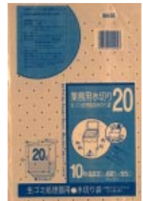
B H - 5 5