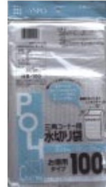
H B - 1 0 0