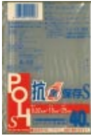
A - 1 0