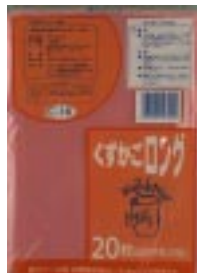
C - 1 6