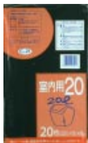
C - 2 1