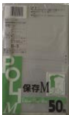
D - 3