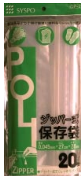
C P - 2