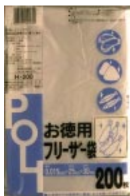
H - 200