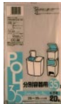
C C - 3 5