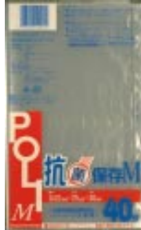
A - 2 0