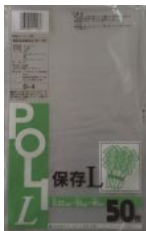
D - 4