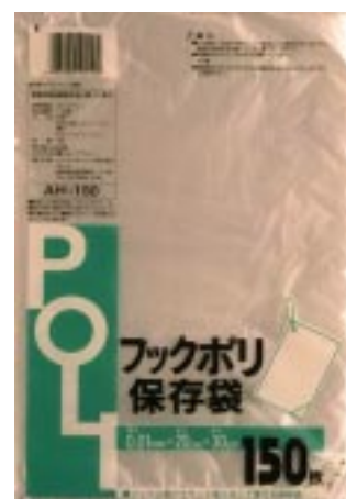
AH - 150